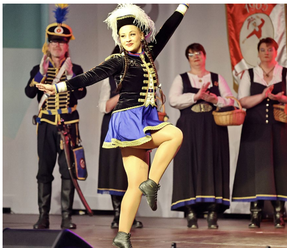
Impressionen der Ehrennarrenkür 2025